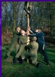
Uitstroomprofiel TC Sportcoördinator Geüniformeerde beroepen