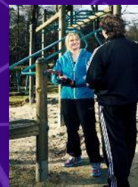
Uitstroomprofiel SBG Sport, Bewegen en Gezondheid