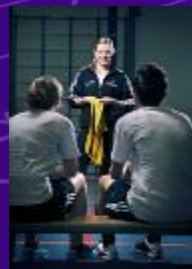
Uitstroomprofiel BOS Buurt, Onderwijs & Sport Coördinator