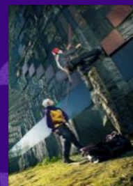
Uitstroomprofiel TC Coördinator Leisure Sports and Adventure