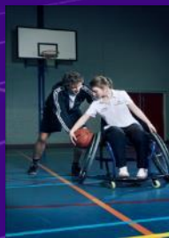
Uitstroomprofiel BAG Bewegingsagogie