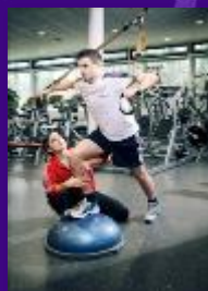
Uitstroomprofiel TC Fitness & Health Coördinator