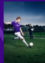
Uitstroomprofiel TC Voetbalcoördinator (UEFA-B KNVB)